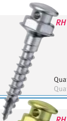
Quattro RH micro pro Quattro RH micro pro